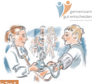
Die Top 5

Less is More? De-Prescribing Pharmaceuticals for Patient Safety and Sustainable Public Health „Less is More?“ ist ein vom Wiener Wissenschafts-, Forschungs- und Technologiefonds (WWTF) gefördertes interdisziplinäres Forschungsprojekt. Forschende von der Universität Wien und der Medizinischen Universität Wien untersuchen die Verwendung von Antibiotika und Benzodiazepinen – und wie diese Medikamente durch Interventionen auf verschiedenen Ebenen des Gesundheitssystems nachhaltiger und sicherer verschrieben werden können. Zur Website: https://health-matters.univie.ac.at/de/projects/lessismore/